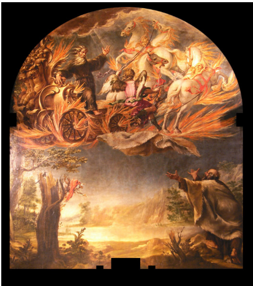
Ilustración 17 Elías arrebatado por el carro de fuego. Juan de Valdés Leal (1655-56). Barroco

Elías en el carro de fuego iii (Rapto numinoso, visión mística muerte)