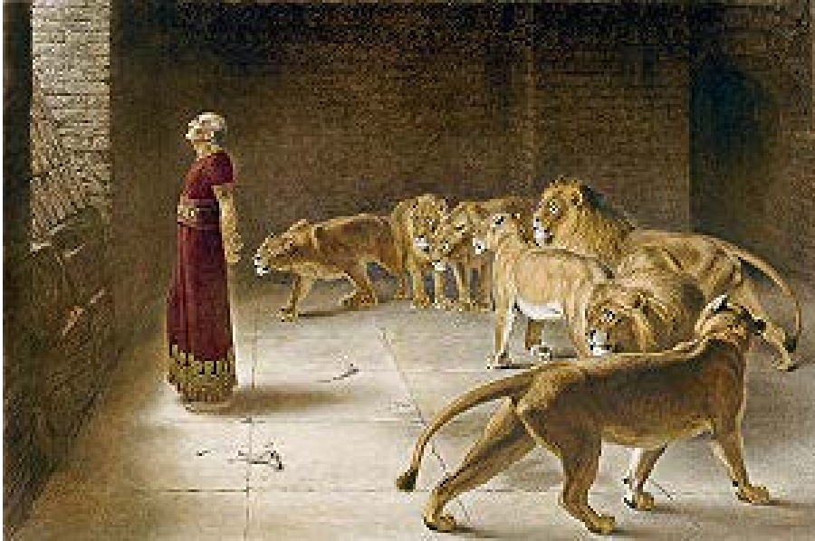
Ilustración 18 Daniel's Answer to the King Briton Rivière 1890. Arte moderno

Daniel's Answer to the King Briton Rivière 1890. Arte moderno En el Manchester City Art Gallery.