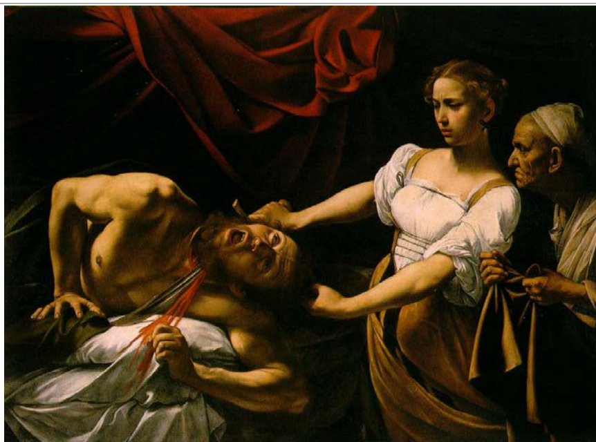
Ilustración 1 Judit y Holofernes. Caravaggio 1598-1599 Barroco

Judit y Holofernes 1598-1599. Galería Nacional de Arte Antiguo, Roma. Pintura al óleo •144x195 cm